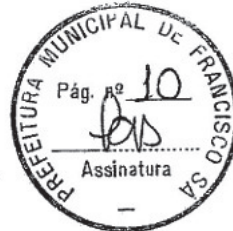
Antônio Soares Dias, Prefeito Municipal.